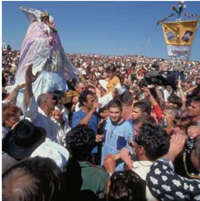
Le pèlerinage du 25 mai aux Saintes-Maries-de-la-Mer

Les Roms ont souvent adopté la religion dominante du pays où ils se trouvaient, en gardant toutefois leur système spécial de croyances. La plupart des Roms sont protestants, orthodoxes ou musulmans.