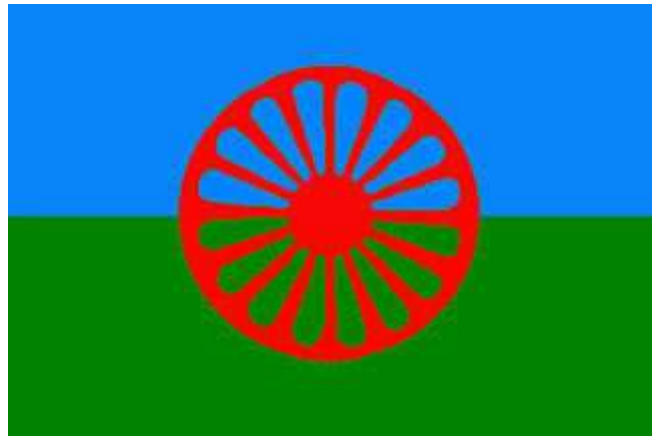
Le drapeau Rom depuis 1971.

D'un point de vue génétique, la distribution de leur groupe sanguin ABO est cohérente avec celle des castes guerrières du nord de l'Inde. Une étude récemment publiée dans le magazine Nature suggère que les Roms sont apparentés aux Cingalais du Sri-Lanka, eux aussi originaires de l'Inde du nord.